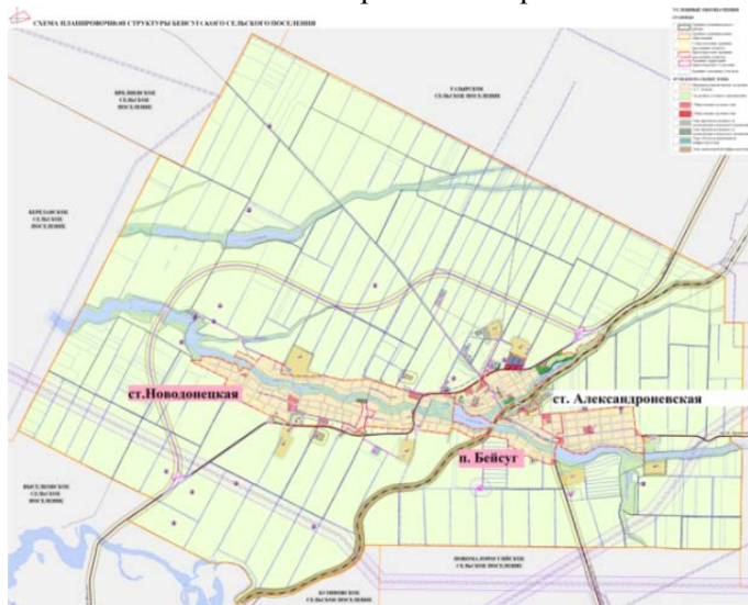
Карта - схема расположения объектов нормирования

Территория поселения не содержит неравномерности в планировочной структуре, застройке, климатических, ландшафтных условиях, уровне социально-экономического развития, транспортной доступности, поэтому принято решение в отсутствии дифференциации его территории.